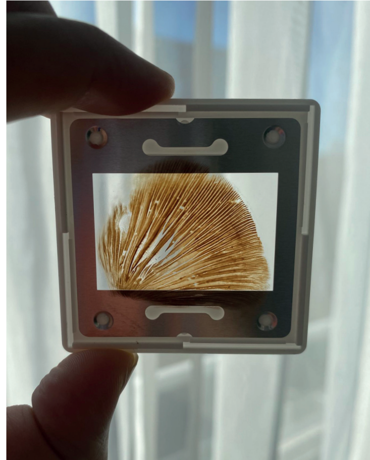
Process photo of mushroom spores on a photographic slide, 2023.

The Amstelpark was created for a world horticultural exhibition, the 1972 Floriade: a typical modern colonial phenomenon where plants, animals and people are taken out of context and detached from their traditions and relationships. In Plantas Harmonias , Farah Rahman explores the cultural meanings of trees and plants from various places around the world and incorporates them into new artworks.