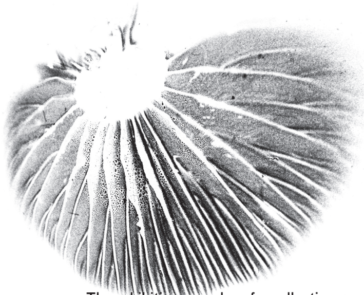
Symphony of Spores; image projection of mushroom spores, 2023. Cover: Sensing Willow; multisensory installation, 2021.